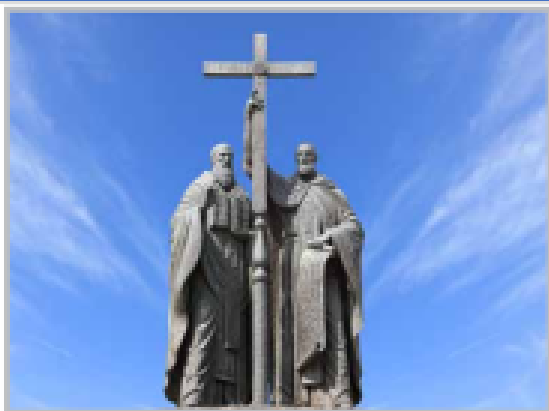
Памятник Кириллу и Мефодию в Москве. Скульптор В.М. Клыков

В 862 моравский князь Ростислав отправил к византийскому императору Михаилу III посольство с просьбой прислать в Моравию (славянские земли, территория современной Словакии) проповедников, которые научили бы славян христианской вере на их родном языке.